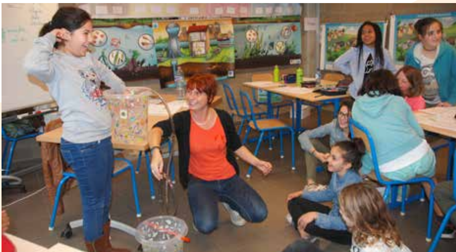
Lors de leur dernière journée de formation, les élèves de Limauges ont appris à siphonner l'eau d'un seau, ce qui les a beaucoup amusés!

La Ville consacre chaque année un budget de près de 4000€ à cette initiative, organisée depuis 6 ans en Brabant wallon. «Il sera augmenté de 1000€ en 2018, pour permettre aux élèves de l'école des Coquerées d'y participer aussi», annonce Ariane Van Dyck, du service Enseignement. ■