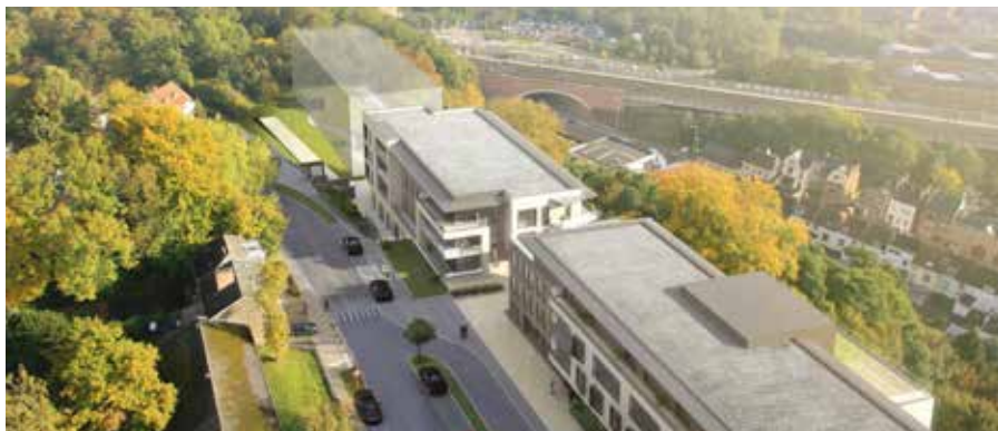
Une maison de repos et de soins de 150 lits (dont un centre de jour de 10 places et deux unités de 15 places chacune pour des résidents désorientés) et une résidence-service de 34 appartements pour séniors autonomes, avant la construction (2 e phase) d'une résidence d'une quarantaine d'appartements pour familles.

La première phase du projet comprend la construction - exemplaire au niveau énergétique - d'une maison de repos et de soins (MRS) de 150 lits, dont un centre de jour de 10 places et deux unités de 15 places chacune pour des résidents désorientés (en travaux jusque fin 2019). Elle prévoit aussi la construction, dans un 2 e