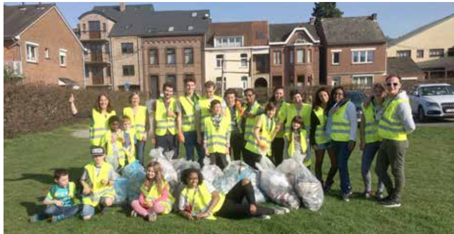
Le patro d'Ottignies a collecté 21 sacs de déchets lors du grand nettoyage «Be WaPP» 2017.

Le patro d'Ottignies recherche des animateurs. En mars, ses jeunes CRACS (Citoyens Responsables, Actifs, Critiques et Solidaires) participeront aux opérations Arc-en-Ciel et Be WaPP.