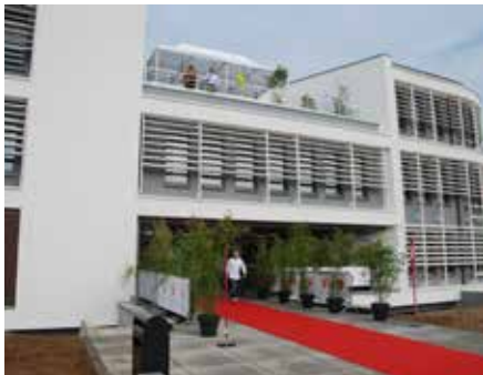
La nouvelle «Aile 1000» de la clinique Saint-Pierre accueille les directions, les services financiers, le département informatique, les banques de données, la médecine du travail...

La clinique Saint-Pierre d'Ottignies a inauguré son nouveau bâtiment administratif, le 22 septembre. Il accueille une centaine de collaborateurs internes (et génère ainsi un gain substantiel d'espace pour les consultations, dans le bâtiment principal).