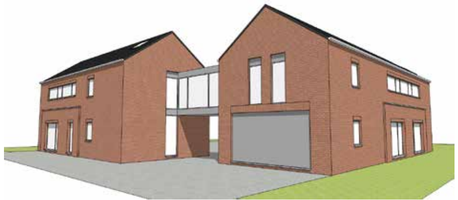
Les scouts du Petit-Ry espèrent pouvoir disposer de leur nouveau bâtiment (deux ailes) d'ici 2020.

Le projet trouvera place sur le terrain de basket occupé par l'Unité, entre l'église et le « local blanc ». Il sera orienté à l'envers par rapport aux locaux actuels, pour sécuriser l'espace situé à l'arrière (il sera isolé de la voirie) et réduire la pollution visuelle/sonore pour le voisinage.