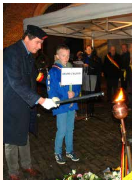
Notre Ville organise la cérémonie de ravivage de la Flamme du Souvenir depuis 11 ans.