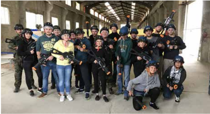
Les employés du Brico d'Ottignies ont testé le «laser game», le 1 er octobre.

Les amateurs de «skate» et de «laser-game» profitent d'un nouveau terrain de jeu, sur le site des anciens Bétons Lemaire, à Mousty.