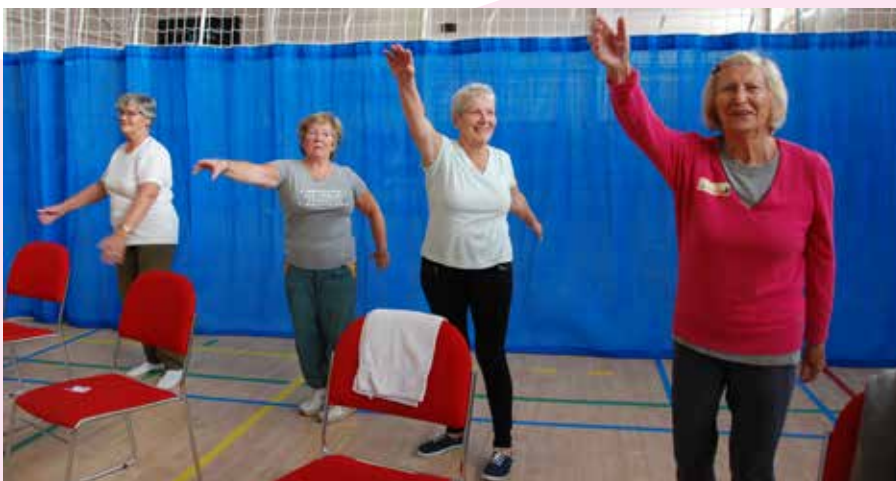
Les séniors ont découvert la gym douce « Viactive Bénin ».