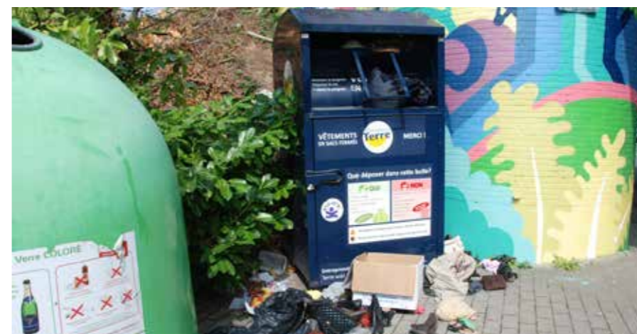
Bulles (verre et textile) à la rue des Deux-Ponts.

Envie de changer de garde-robe? Les vêtements dont vous ne voulez plus feront certainement des heureux. Mais veillez à ce qu'ils soient propres et en bon état. Les déchets ne vont pas dans les bulles!