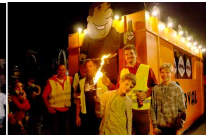
Le char de Limauges.

un énorme bac d'Orval. « A l'échelle 9.6 », nous a-t-il été précisé. Rempli de bouteilles, avec leur étiquette représentant la truite et l'anneau. Une incroyable structure à l'intérieur.