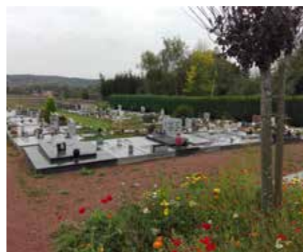
Le cimetière de Limelette.

Le produit nettoyant: cristaux de soude, savon noir (uniquement sur les pierres lustrées), savon