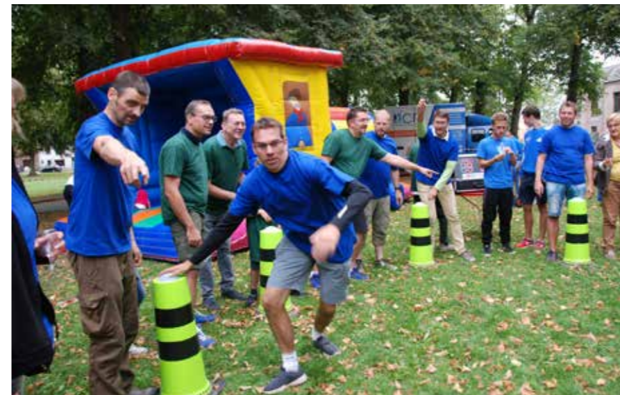
Nos habitants qui ont participé aux jeux interquartiers ont donné le meilleur d'eux-mêmes. Bravo à tous!

Félicitations aux Ottintois! Ils ont remporté les jeux interquartiers 2018, le 26 août à Cérœux.