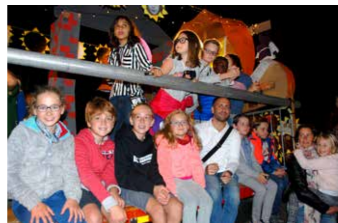
Le char de Limelette.