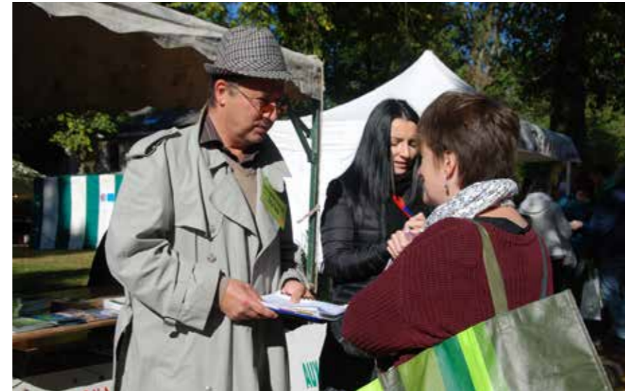
Dans le cadre de son « Analyse partagée du territoire », le Centre culturel a mis en place plusieurs dispositifs originaux (ici de faux inspecteurs, lors de la Fête de la Pomme en 2016) pour questionner et écouter les gens, afin de connaître leurs attentes.

D ans son nouveau projet de contrat-programme déposé fin juin à la Fédération Wallonie-Bruxelles - le Centre culturel détaille son ambition d'animer davantage la Ferme du Douaire.