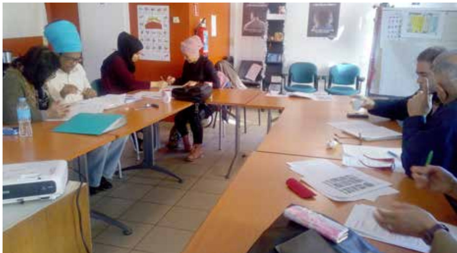
Les étudiants du cours de français-langue étrangère.

L'ASBL - dont les locaux sont installés dans le bâtiment de la cure, à côté de l'église Saint-Remy (Ottignies) - organise 4 cours de « FLE » : l'alphabétisation, le niveau