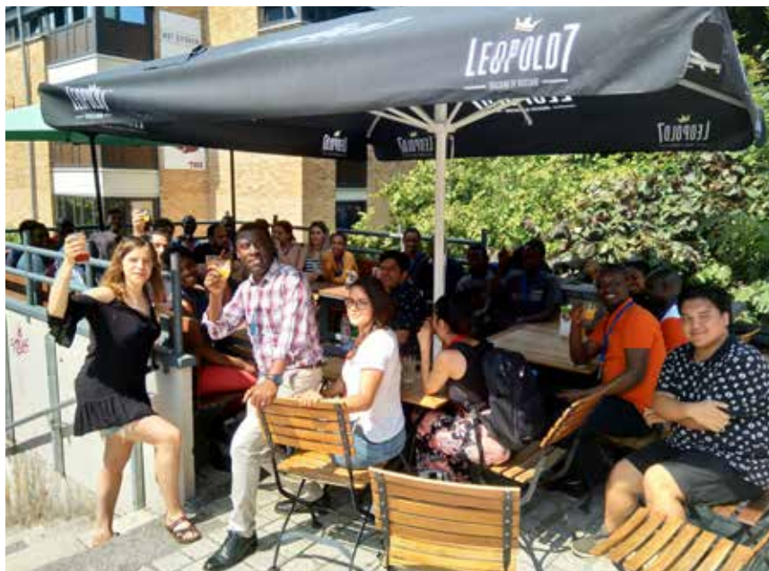
La vie à Louvain-la-Neuve est riche aussi de ses « après cours ». Les candidats au programme Access2University rencontrent des représentants du monde associatif, au café Altérez-Vous.