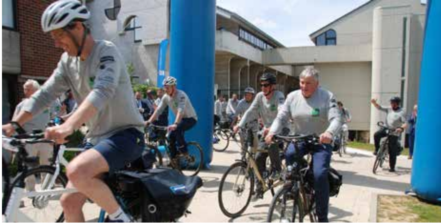
Le recteur de l'UCLouvain, l'échevin du Tourisme... se lancent à la découverte de la Big Bang Route.

Un nouveau parcours cyclable relie Louvain-la-Neuve et Leuven (75km l'aller-retour), en l'honneur de Georges Lemaître, l'inventeur de la théorie du Big Bang.