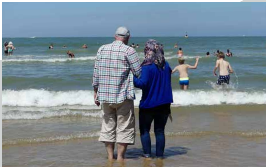
Une journée à Ostende, le 5 juillet.

«Il y a presque autant de bénévoles du Gracq que d'apprentis cyclistes: un beau mélange de cultures et de générations. La police participe à une journée, cela permet de briser les stéréotypes. Le dernier jour, on fait une balade et on mange ensemble.»